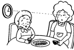
話し相手のみ・留守番