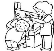
身体の清拭・洗髪