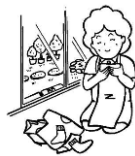
衣服の整理・被服の補修