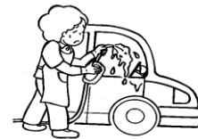
自家用の洗車・清掃