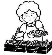
特別な手間をかけて行う料理 (おせち料理など)