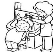
身体の清拭・洗髪