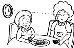
話し相手のみ・留守番